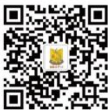
汕头大学商学院MBA教育中心